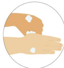
No olvides el pulgar