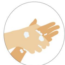
Frota entre sí las palmas de tus manos