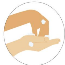
Frota las uñas de sus manos