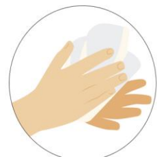
Sécalas muy bien