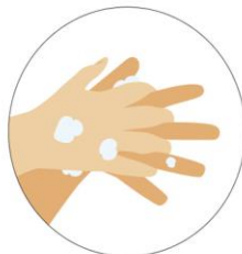
Hazlo también entre tus dedos