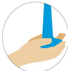
Moja tus manos

EL LAVADO DE MANOS. El procedimiento adecuado, paso a paso, lleva su tiempo y dedicación.