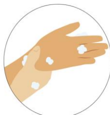
Lava también tus muñecas